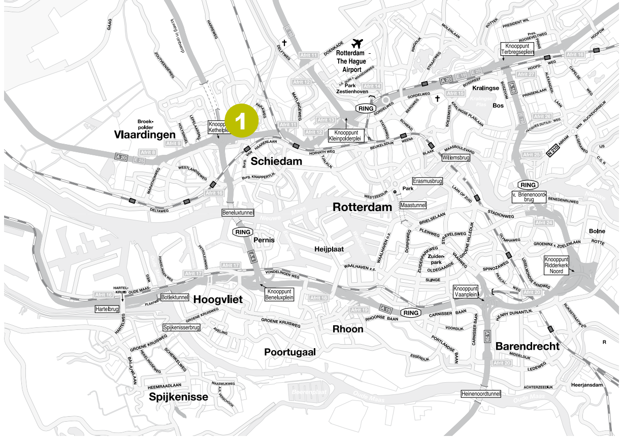
1 Schiedamseweg 245, Schiedam